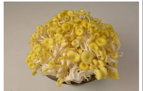
珊 瑚 菇